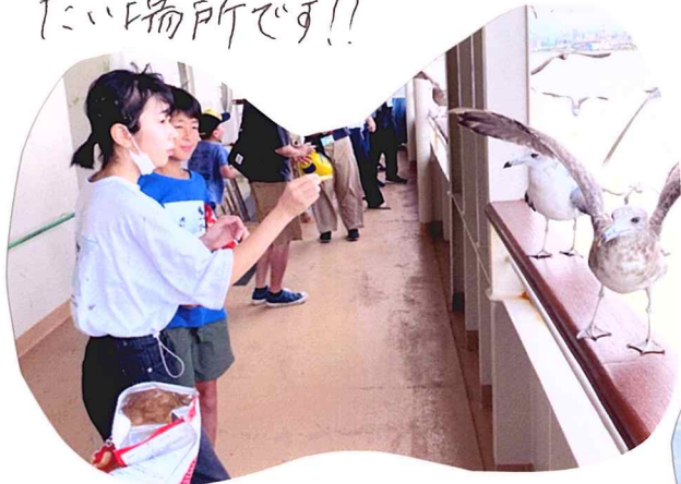
晴れていると外の景色もきれいです!

海に囲まれ、自然が豊かな場所でしたので、いつか行く機会があればみなさんにも行ってもらいたい場所です!!