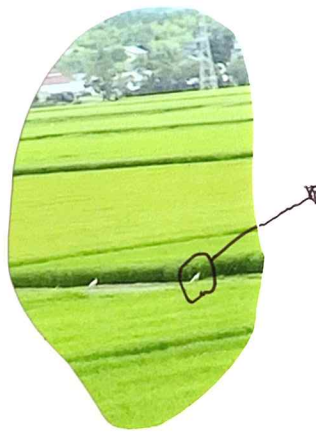
天然のトキです。小さくひかりにくいですが、天然記念物のトモ。