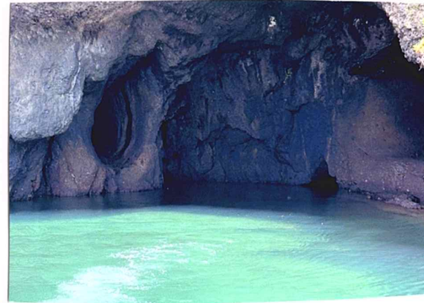
佐渡の青の洞窟とも言われ、今回私が一番行きたかった場所です。海がとてもきれいでした!

お天気にも恵まれ、とても良い方旅行でした! もちろん紫外線ケアも忘れずにしていました。夏の終わりは日差しが暑いので、ターツも出やすくなっています。トリートメントをサロンで行うことで、より髪へのひっかりも少なくなり、抜け毛も減るので、ぜひケアを試みて下さい!